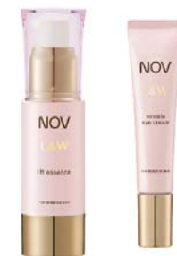
ノブ L & W シリーズ