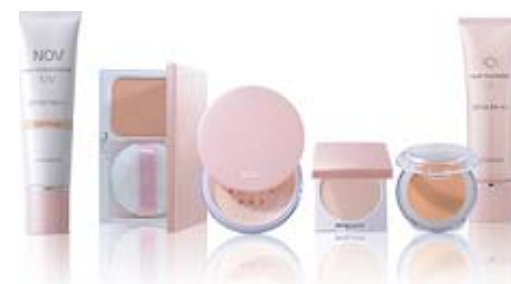
ノブ メイク シリーズ