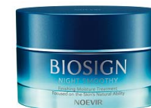
バイオサイン 薬用ナイトスムージー