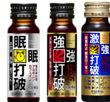
睡眠打破シリーズ