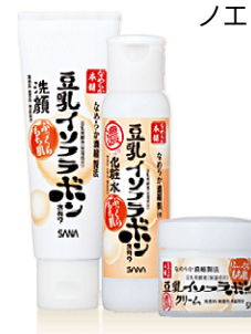
なめらか本舗シリーズ