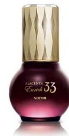
ノエビア エンリッチ 33