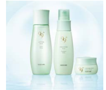
ノエビア 99プラスシリーズ