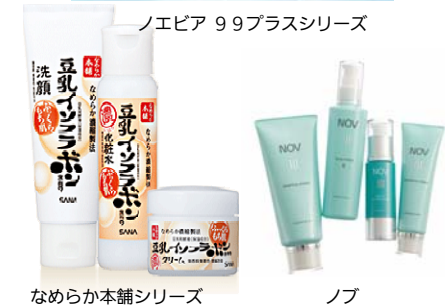
なめらか本舗シリーズ