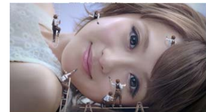
毛穴パテ職人 2015年秋プロモーション