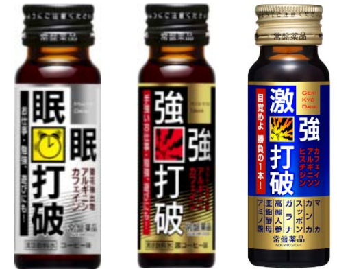
睡眠打破シリーズ

売上高：9億54百万円 前期 5億74百万円 (+3億79百万円 +66.0%) 営業利益：△1億22百万円 前期 △19百万円 (△1億03百万円)