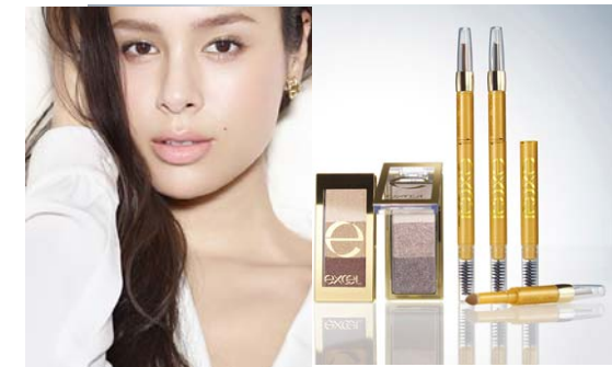
エクセル 2015年秋プロモーション