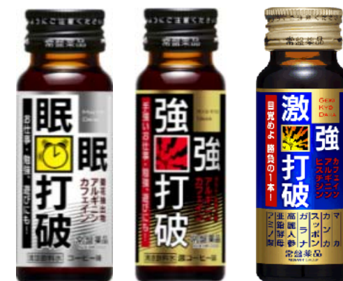
睡眠打破シリーズ