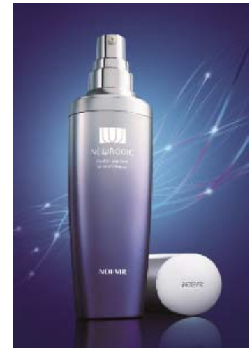
ノエビア ニューロジック 薬用セラム